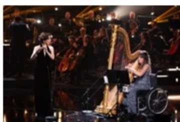
Victoire de la musique 2025