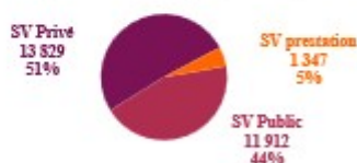
Graphique 1 : Répartition des employeurs du spectacle vivant en 2024 (en nb et %)