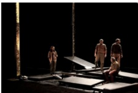
Orchestre Opéra de Paris Théâtre des Célestins Festival Sens Interdits