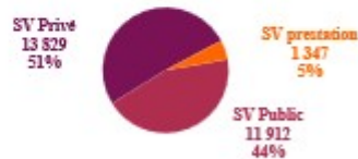
Graphique 1 : Répartition des employeurs du spectacle vivant en 2024 (en nb et %)