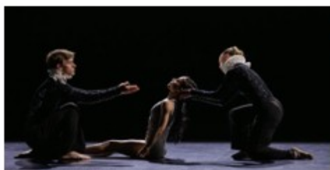
Ballet Prejocaj Pavillon Noir Grande Halle de la Vilette

Le spectacle vivant : un secteur composite, dynamique et innovant