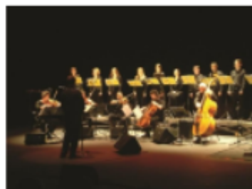
Orchestre (Spectacle vivant national)