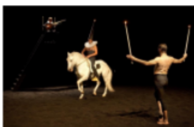
Art de l'équitation (Spectacle vivant national) Théâtre équestre de Paris 2014