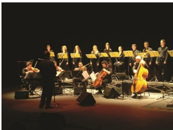
Dibbouk L'Apostrophe scène nationale