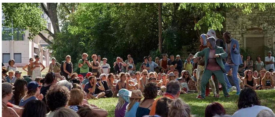
Arts de la rue

Le lieu accueillant est un entrepreneur exploitant de spectacles vivants. Les jauges sont très variables, allant du micro-lieu aux salles/sites accueillant plusieurs milliers de spectateurs. Petit lieu de proximité au public local ou salle mythique à la renommée internationale accueillant des touristes du monde entier, tous proposent des espaces de bar ou de restauration gérés en interne ou confiés en prestation.