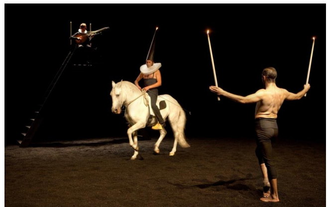
On achève bien les anges (élogie) Théâtre équestre Zingaro 2016