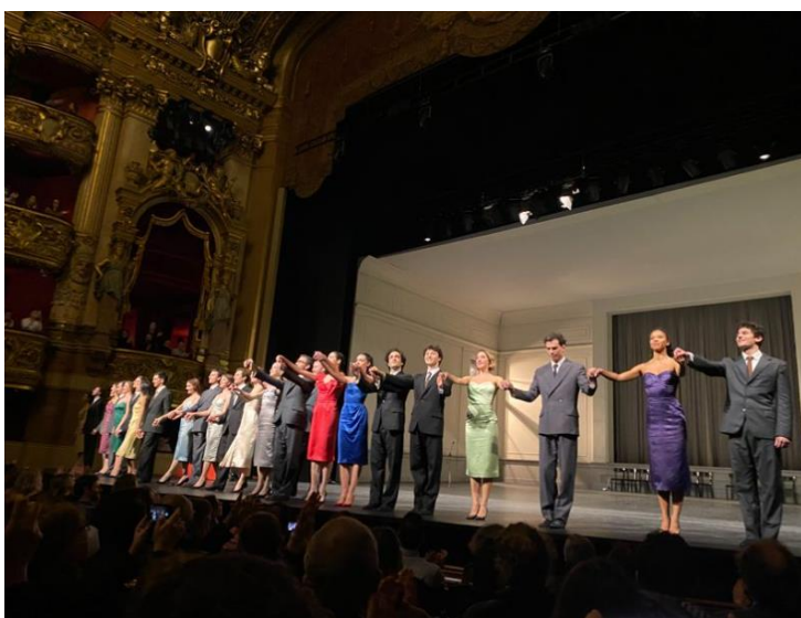
« Kontakt Hof », un ballet de Pina Bausch Opéra du Paris - 2022

Ainsi, très peu d'entreprises ont la capacité de mener de la GPEC à moyen et longs termes (gestion prévisionnelle des emplois et des compétences).