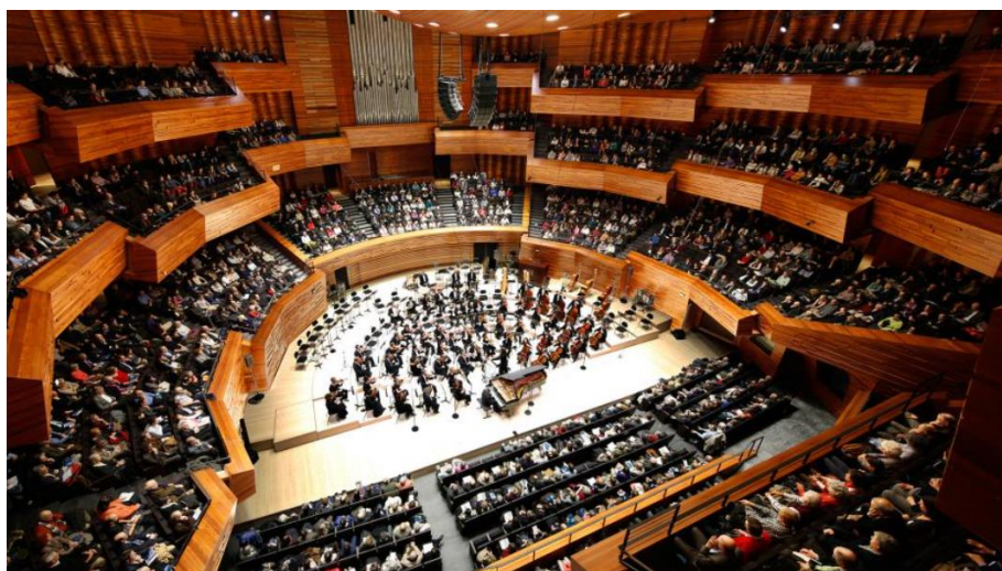
Auditorium de la Maison de la Radio et de la Musique - Architecte : AS Architecture Studio.