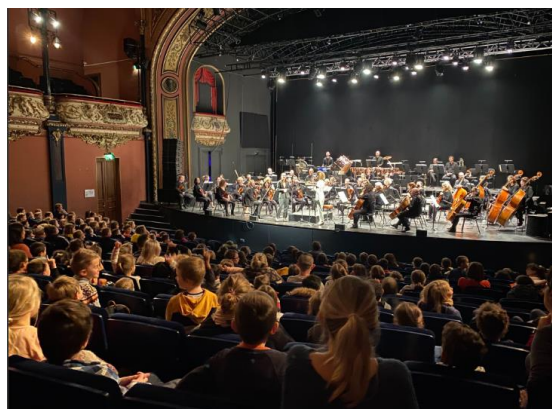
Pierre et le Loup, joué pour un public de scolaires @ Opéra national de Lorraine

En accompagnement des représentations, des actions culturelles peuvent également être proposées par les équipes artistiques : ateliers, rencontres artistiques, spectacles pédagogiques, initiations, débats... dans les lieux culturels ou en dehors, notamment pour des publics spécifiques (scolaires, entreprises) ou des publics empêchés (milieu hospitalier ou pénitencier).