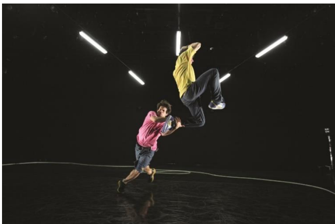
H3 L'Apostrophe scène nationale @ Bruno Beltrao

Musique, chant, opéra, danse, théâtre, conte, marionnettes, stand up, arts du cirque, comédies-musicales, cabaret, music-hall, magie... Le spectacle vivant : un secteur composite, dynamique et innovant