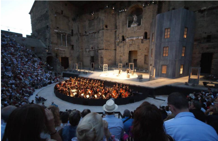
Chorégraphie d'Orange

Que les entreprises relèvent du secteur public (subventionné) ou privé, leurs objectifs ne sont pas consuméristes ni productivistes. A ce titre, les activités du spectacle vivant sont essentielles à la Nation et elles bénéficient du soutien des pouvoirs publics et d'une réglementation protectrice. Cette exception culturelle induit des caractéristiques socio-économiques qui structurent le marché du travail différemment des autres secteurs.