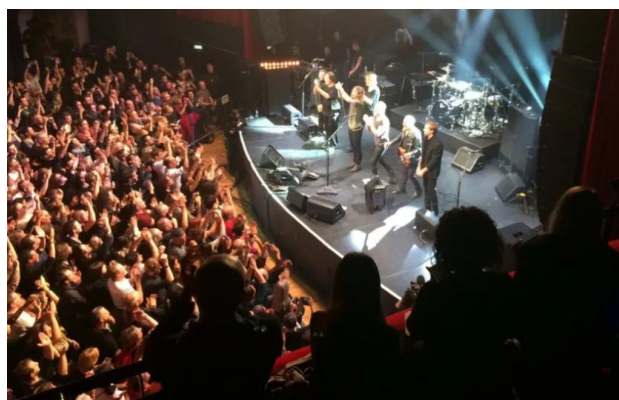
Concert de Sting au Bataclan 2016

Même si les professionnels du spectacle sont réactifs et s'adaptent au quotidien, l'impact de ces événements a de fortes répercussions sur les équipes, l'organisation du travail et les aspects budgétaires.